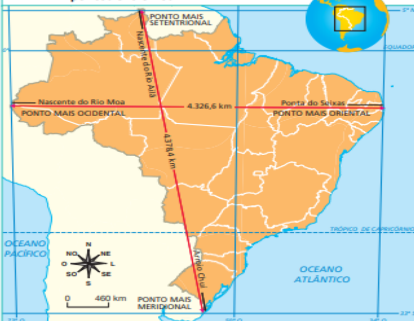
Figura 6. Brasil: distância entre os pontos extremos

Qual é a diferença de extensão entre as distâncias norte-sul e leste-oeste do território brasileiro?