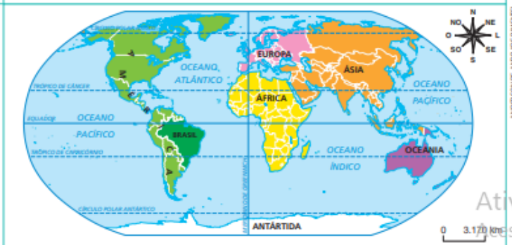
Figura 1. O Brasil no planisfério

O território brasileiro pode ser localizado com base na divisão do mundo em hemisférios. Considerando que no globo terrestre o Meridiano de Greenwich define o leste (ou oriente) e o oeste (ou ocidente) e que a linha equatorial define o norte (ou setentrional) e o sul (ou meridional), observe a localização do Brasil na figura 1.