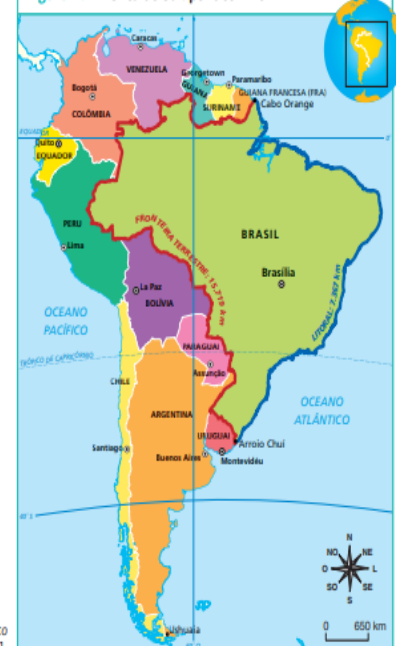
Figura 4. América do Sul: político - 2017

Fonte: elaborado com base em IBGE. Atlas geográfico escolar. 7. ed. Rio de Janeiro: IBGE, 2016. p. 41 e 91.