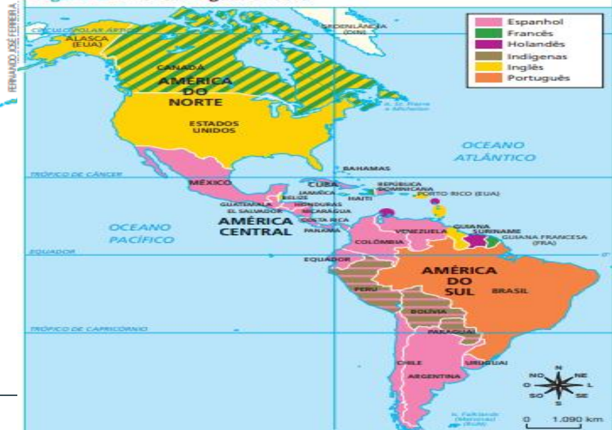
Figura 5. América: línguas oficiais